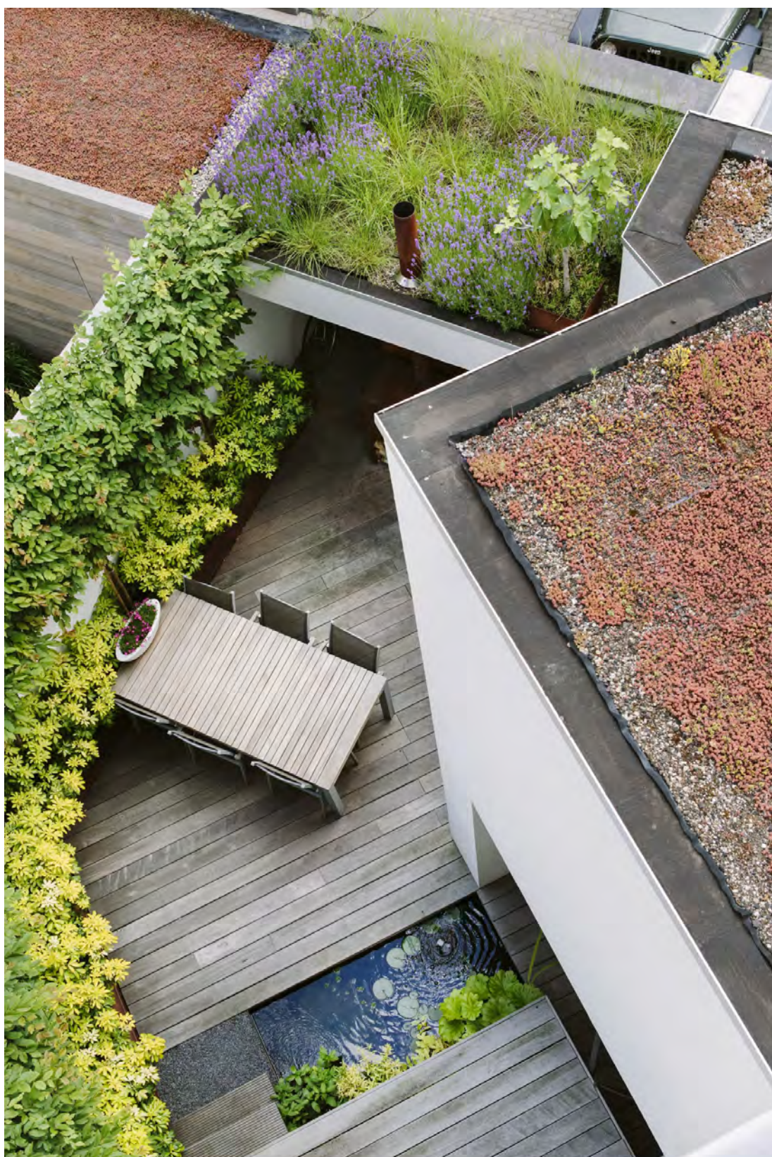
Geen kale muren en roofingdak, maar weelderige tuinwanden en zicht op een kleurrijk groendak.

Een terras, een loungeplek, een eethoek, een waterpartij, boompjes, planten en bloemen, een groendak, een houtvuur én ruimte voor filmprojecties, en dat allemaal in een stadstuin van 60 m 2 groot? Bij Brigitte en Paul is dat gelukt. Met veel creativiteit én met de hulp van een tuinaannemer die even enthousiast was als zijzelf. KARIN ECKHOUT